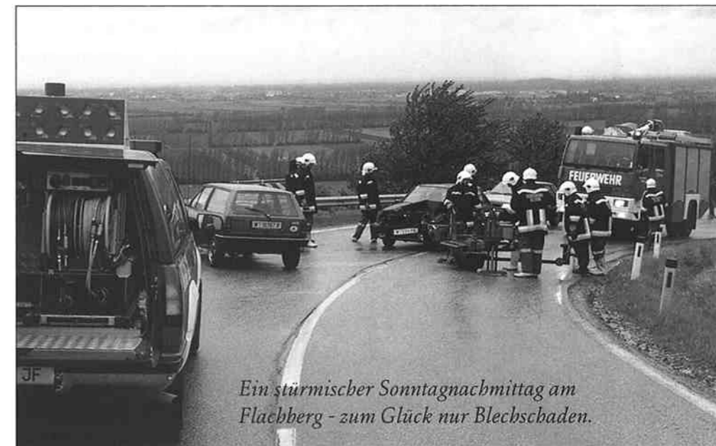
Ein stürmischer Sonntagnachmittag am Flaaberg - zum Glück nur Blebschaden.