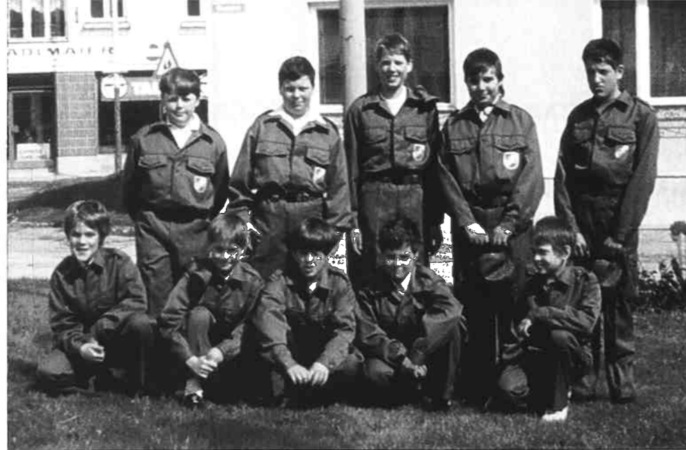
Angelobung am 1. Mai 1992.