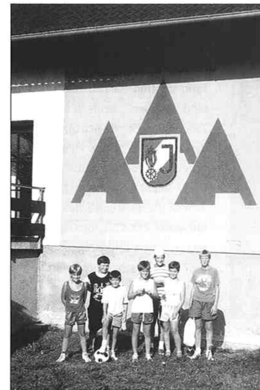
Haus der NÖ Feuer-wehrjugend in Alten-markt i. Yspertal.

Eine große Herausforderung für die Feuerwehrjugend ist die Vorberei-tung und Ablegung der einzelnen Wissensteste innerhalb des Bezirkes sowie die Teilnahme an den Feuer-wehrjugendleistungsbewerben, für unsere Buben in diesem Jahr ein sehr großer Erfolg.