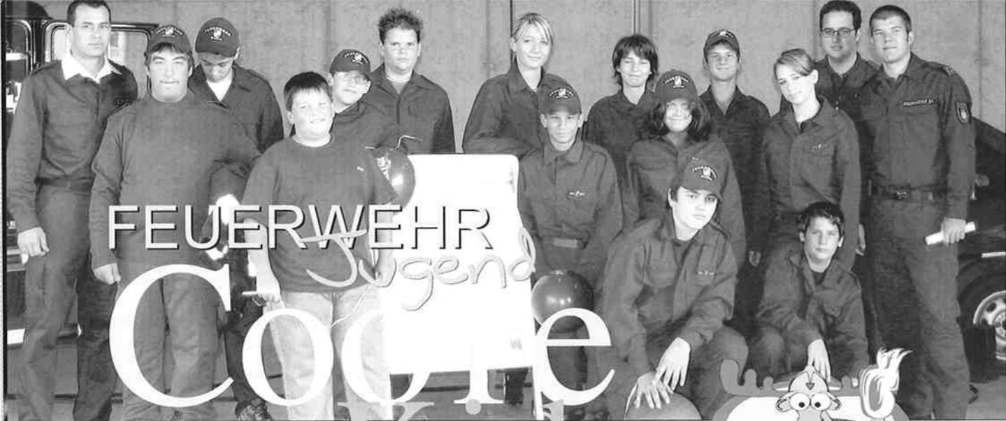
Zu Besuch in der neuen Landesfeuerwehrschnule

Am 1. April 2006 fand als Abschluss der Winterausbildung unserer Feuerwehrjugendgruppen des Bezirkes Tulln in Ollern der Wissenstest statt. Dieser Test ist eine Prüfung, bei dem das erworbene Wissen, welches der Grundausbildung eines Feuerwehrmitgliedes angerechnet wird, gezeigt werden muss. Der Test umfasst die Ausbildungsbereiche Organisation, Dienstgrade und vor allem den wichtigen praktischen Teil, bei dem die Geräte für den technischen Einsatz und die Brandbekämpfung richtig zu erkennen und zu bedienen und die Funktionen zu erklären sind. Unsere Jugendlichen nahmen in den folgenden Klassen erfolgreich teil: