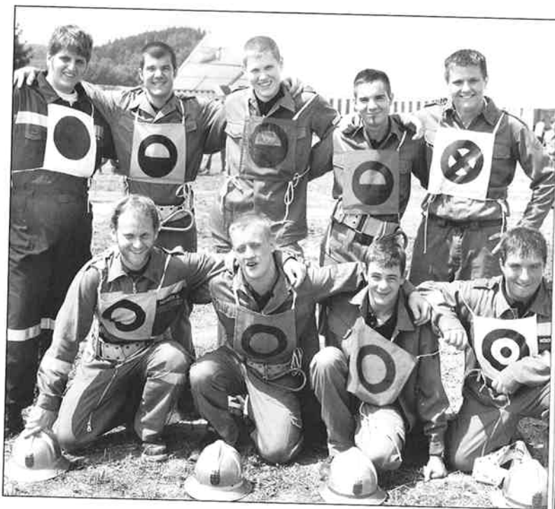
Die Zukunft liegt in der Jugend

Zum bevorstehenden Jahresende wünsche ich Ihnen und allen FeuerwehrkameradInnen ein gesegnetes Weihnachtsfest, Gesundheit und viel Erfolg im Jahr 2007.